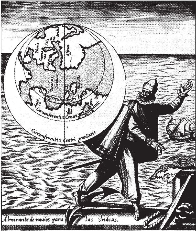
Fig. 2. Don Cristóbal Colón.