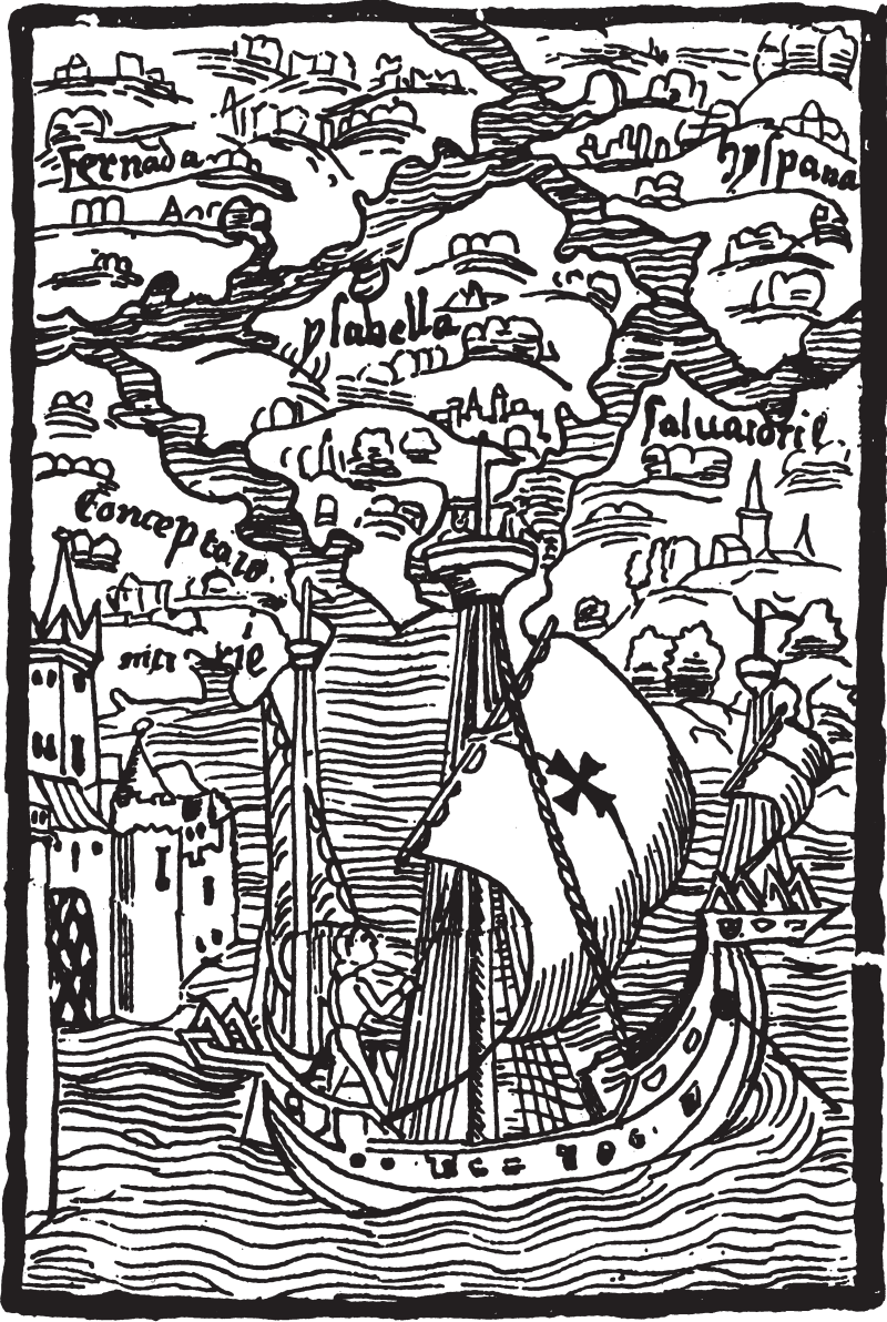
Fig. 1. Barcos y castillos en las Indias occidentales.